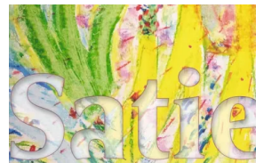
Satie – Celloland