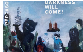
DAY & TAXI: Run, The Darkness Will Come!